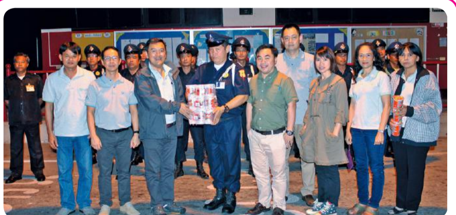
ผู้บริหาร Saha Land Property Holdings-SLPH พบปะพนักงาน บจก. รักษาความปลอดภัย เวสเทิร์น

ทำให้มีความรู้และเข้าใจเกี่ยวกับระบบนิเวศมากขึ้น ขอขอบคุณพี่เลี้ยง ศูนย์ฯ สิ่งแวดล้อม ที่นำพวกเรามาศึกษาสิ่งแวดล้อมและธรรมชาติ อยากให้เพื่อนๆ เห็นคุณค่าของสิ่งแวดล้อมในบ้านเราเอง ช่วยกันดูแลรักษาให้ดี เพื่อบ้านเรา” โดยกิจกรรมต่อยอดของโครงการนี้ คือ การนำผลที่ได้จากการสำรวจ มาร่วมพูดคุยทำบทสรุปร่วมกัน เพื่อให้ข้อมูลเชิงลึกกับเด็กๆ เกิดความเข้าใจในเรื่ององค์ประกอบต่างๆ ที่เกื้อหนุนกันของสิ่งมีชีวิตชนิดต่างๆ ในสิ่งแวดล้อมมากขึ้นซึ่งทางทีมข่าวฯ จะนำเสนอในโอกาสต่อไป