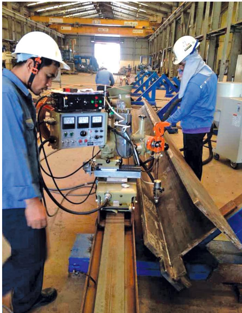
WCE คว้ามาตรฐานการผลิตโครงสร้างเหล็กประกอบประเภทเสาและคาน ได้รับการรับรองมาตรฐานการผลิตโครงสร้างเหล็กจากสถาบัน JSCA (Japan Structural Consultants Association) เตรียมเดินหน้าผลิตและส่งออกผลิตภัณฑ์โครงสร้างเหล็กประกอบประเภทเสาและคานไปยังตลาดประเทศญี่ปุ่น

WCE ได้รับการรับรองมาตรฐานการผลิตโครงสร้างเหล็ก (M-Grade) จากสถาบัน JSCA (Japan Structural Consultants Association) และมาตรฐานช่างเชื่อมจากประเทศญี่ปุ่น สถาบัน JWES (Japan Welding Engineering Society) เพื่อผลิตจำหน่ายและส่งออกไปยังตลาดประเทศญี่ปุ่น สร้างมูลค่าเพิ่มให้แก่ผลิตภัณฑ์จับมือพันธมิตรเหล็กมิตรชยุหนุศลลาด วัตถุประสงค์ และการส่งออก มั่นใจปี 2560 ขายได้ 7 พันตัน