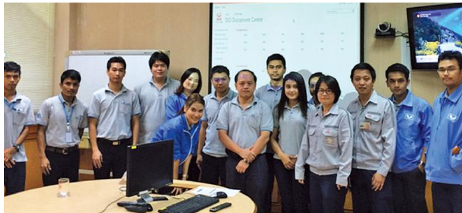
บริษัท สหวิริยาโลจิสติกส์ จำกัด ได้นำคณะพนักงาน จำนวน 11 คนเข้าร่วมศึกษาดูงานระบบควบคุมและจัดเก็บเอกสาร ระบบงานบริหารคุณภาพ TS16949 & ISO9001 ด้วยระบบออนไลน์ ของบริษัท สหวิริยาสติลอนดีสตริ จำกัด (มหาชน) หรือเอสเอสไอ ณ โรงงานเอสเอสไอบางสะพาน จังหวัดประจวบคีรีขันธ์ เมื่อเร็วๆ นี้