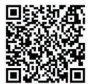
อ่านข่าวคนเหล็กฉบับอิเล็กทรอนิกส์

แวดล้อมในการทำงานอย่างยั่งยืน จึงมีมาตรการป้องกันและแก้ไขผลกระทบด้านสิ่งแวดล้อม จัดทำแผนงานในการเพิ่มพื้นที่สีเขียวตามแนวทางอุตสาหกรรมเชิงนิเวศน์ ซึ่งนอกจากจะได้ผลดีในการลดปัญหาเรื่องฝุ่นแล้วยังส่งผลดีในด้านอื่นๆ ตามมาอีกด้วย อ่านต่อ U.2