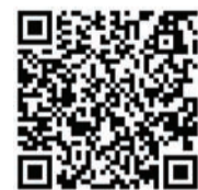
อ่านข่าวคนเหล็กฉบับอิเล็กทรอนิกส์

บริษัท สหวิริยา สตีลอินดัสตรี จำกัด (มหาชน) หรือ เอสเอสไอ เห็นถึงความสำคัญของบุคลากร ซึ่งเป็นทรัพยากรที่สำคัญและเพื่อสร้างสรรคบรรยากาศการทำงานที่ดีให้พนักงานมีความสมดุลระหว่างชีวิตและครอบครัว หนึ่งในนโยบายพัฒนาบุคลากร และสิทธิมนุษยชน จึงได้กำหนดแนวทางกิจกรรมผ่านโครงการให้คำปรึกษาทางด้านกฎหมายเคลื่อนที่ “ก๊วยโก๊ะ on tour 2014” ที่โรงงานเอสเอสไอบางสะพาน อ่านต่อ น.4