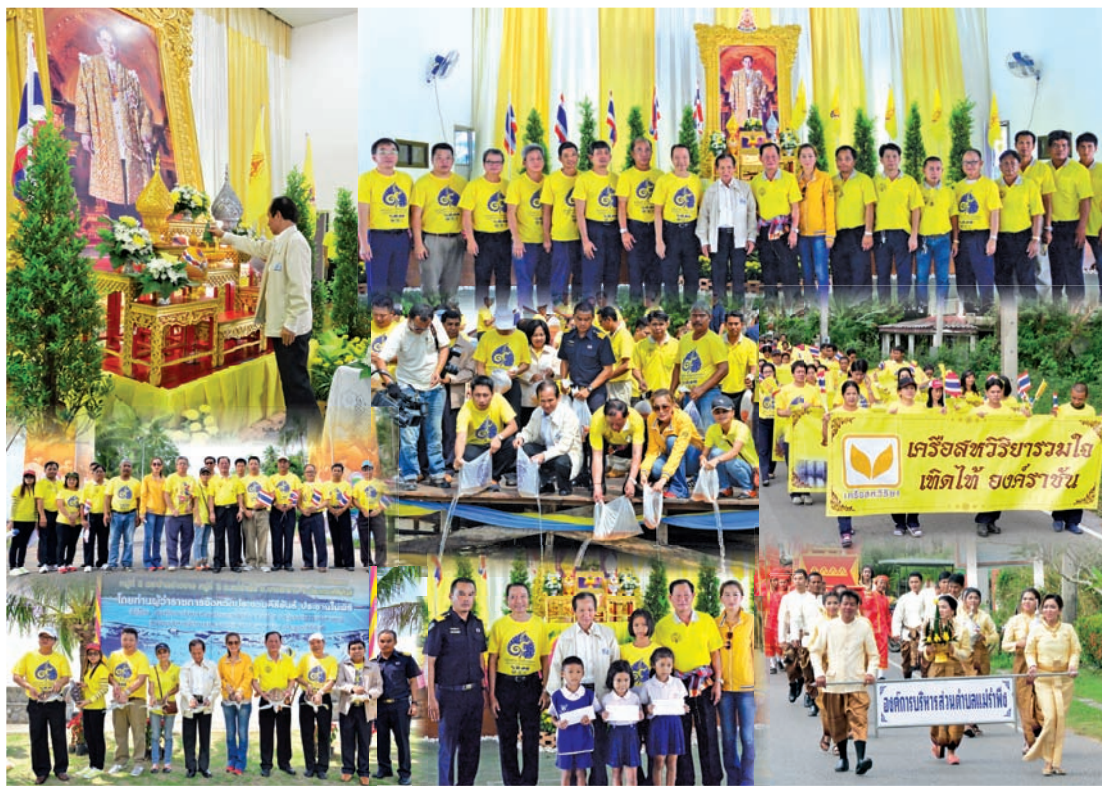
เครือสหวิริยา ผอ.นิกรกำลังองค์การบริหารส่วนตำบลแม่รำพึงและอำเภอบางสะพานจัดกิจกรรมเฉลิมพระเกียรติพระบาทสมเด็จพระเจ้าอยู่หัว เนื่องในโอกาสสมโภชตรุษศิวะ 87 พรรษา 5 ธันวาคม พ.ศ. 2557 พร้อมทั้งชื่นชมความอุดมสมบูรณ์ให้แก่ธรรมชาติ ทรัพยากรชายฝั่งของอำเภอบางสะพาน และเพิ่มแหล่งอาหารแหล่งรายได้ให้แก่ชาวประมงในชุมชน ณ บริเวณหน้าองค์การบริหารส่วนตำบลแม่รำพึง อ.บางสะพาน จ.ประจวบคีรีขันธ์ อ่านต่อ U.2

เครือสหวิริยา อบต.แม่รำพึง อ.บางสะพาน หน่วยงานภาครัฐ และชาวบางสะพาน จับมือจัดโครงการ “เทิดทูนสถาบันพระมหากษัตริย์ รักในหลวง รักษ์บางสะพาน2557” พนักงานและประชาชนกว่า 1,400 คนร่วมเดินเทิดพระเกียรติระยะทางสามกิโลเมตร พร้อมร่วมกับผู้ว่าราชการจังหวัดปล่อยพันธุ์สัตว์น้ำทะเล อาทิ พันธุ์เต่า กุ้ง และปลา จำนวนรวมเก๋าล้านตัว เพื่อแสดงถึงพลังความสามัคคี ความจงรักภักดีต่อสถาบันพระมหากษัตริย์ ถวายเป็นพระราชกุศลแด่พระบาทสมเด็จพระเจ้าอยู่หัวฯ เนื่องในโอกาสสมโภชตรุษศิวะ 87 พรรษา 5 ธันวาคม 2557 พร้อมทั้งชื่นชมความอุดมสมบูรณ์ให้แก่ธรรมชาติ ทรัพยากรชายฝั่งของอำเภอบางสะพาน และเพิ่มแหล่งอาหารแหล่งรายได้ให้แก่ชาวประมงในชุมชน ณ บริเวณหน้าองค์การบริหารส่วนตำบลแม่รำพึง อ.บางสะพาน จ.ประจวบคีรีขันธ์ อ่านต่อ U.2