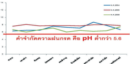
ค่าจำกัดความฝนกรด คือ pH ต่ำกว่า 5.6

- และรถยนต์ที่จอดและบนแผ่นพลาสติกในพื้นที่ของบริษัท สหวิริยา สตีลอินดัสตรี จำกัด (มหาชน) SSI โดยผลที่ได้มี 4 หน่วยงานซึ่งแจ้งตรงกันว่า ผลจากการวิเคราะห์ “หอยดเหลือง” นั้นไม่ใช่สารเคมีที่เป็นอันตราย ซึ่งลักษณะที่พบนั้นเป็นหอยดขนาดประมาณ 0.2 มิลลิเมตร - 1 เซนติเมตร เมื่อปรากฏใหม่จะมีสีเหลืองสดแต่เมื่อแห้งจะซีดลงและเป็นผงหูลูร่อนโดยไม่ก่อมลพิษและไม่ทำให้เกิดการระคายเคือง ซึ่งข้อสรุปผลตรวจจากการทดสอบของ 3 สถาบัน สรุปไว้ ดังนี้